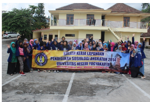
KKL (Kuliah Kerja Lapangan)