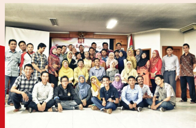
Ikatan Alumni "FONDASI"